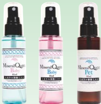
ミネラルクオン ベビー アクアブルー／ピンク 80ml ペット 80ml 各 720円（税別）400P