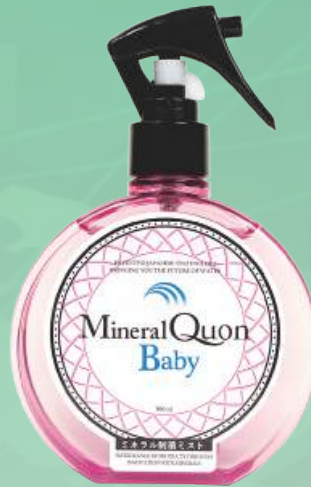
ミネラルクオン ベビー ピンク 300ml 2,700円（税別）1,500P