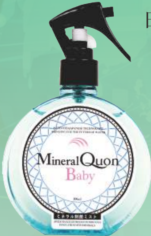
ミネラルクオン ベビー アクアブルー 300ml 2,700円（税別）1,500P