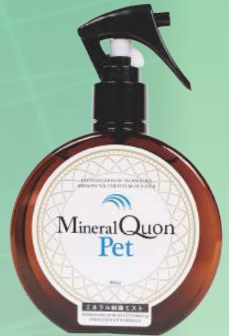
ミネラルクオン ペット 300ml 2,700円（税別）1,500P